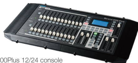
200Plus 12/24 console