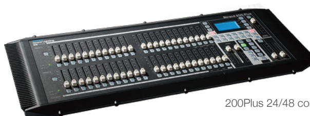
200Plus 24/48 console